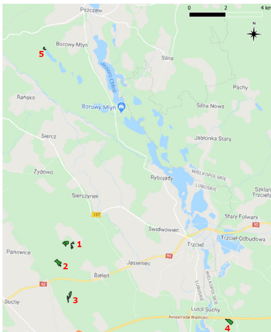
Ryc.1. Orientacyjne rozmieszczenie łąk (1-4) i torfowiska (5).